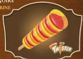
SUPER TWISTER® PARFUMS ORANGE/FRAISE/CITRON ORANGE/STRAWBERRY/LEMON FLAVOURS