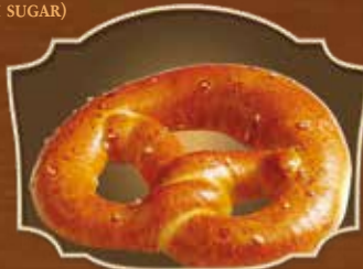
BRETZEL SUCRÉ SWEET PRETZEL