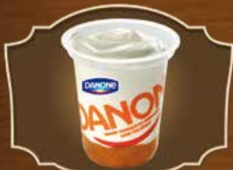
YAOURT DANONE® SUR LIT DE FRUITS FRUIT YOGHURT (WITH SUGAR)