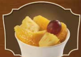
COUELLE DE FRUITS FRAIS (SANS SUCRE AJOUTÉ) FRESH FRUIT CUP (NO ADDED SUGAR)