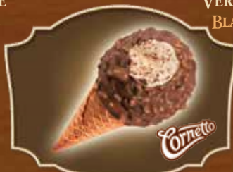
CORNETTO® CHOC'N'BALL CHOCOLAT AU LAIT/VANILLE/AMANDES MILK CHOCOLATE/VANILLA/ALMONDS