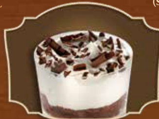
VERRINE FORÊT NOIRE BLACK FOREST VERRINE