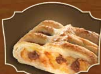
STRUDEL AUX POMMES APPLE STRUDEL